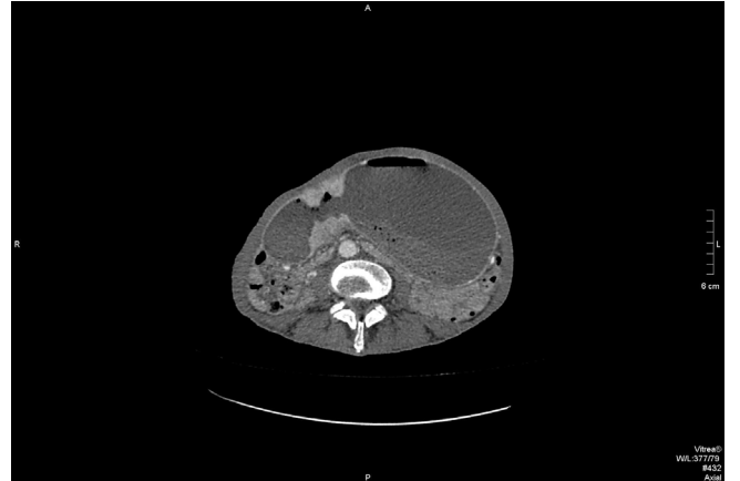
Figür 2. Batın Tomografisi kronal kesit